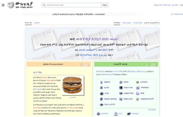
(a) Amharic article about the Big Mac burger.